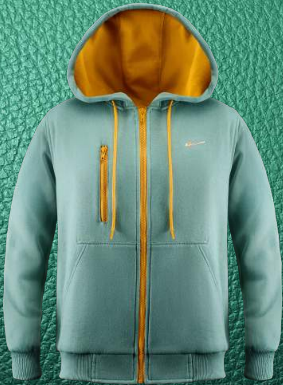
Soft Green Hoodie